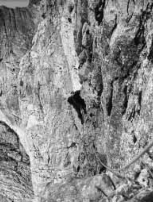
Vor der „Hakengalerie“