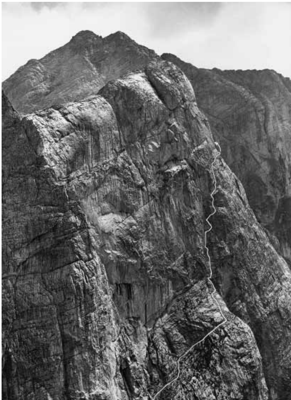
Gesäuseberge: Dachl-Nordwand, Originalanstieg